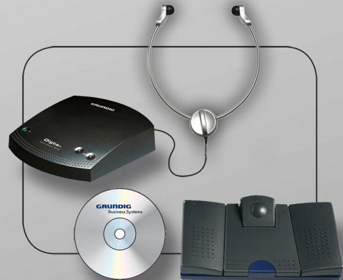
Digta Soundbox 830

Das fertige Diktat der Klageschrift, des Mahnverfahrens oder ähnlichem wird als Sprachdatei an den Schreibservice oder an eine Spracherkennungssoftware geschickt.