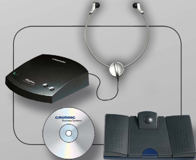
Digta Soundbox 830

Das fertige Diktat des Urteils, Protokolls, der Verfügung, des Schriftverkehrs oder ähnlichem wird als Sprachdatei an den Schreibservice oder an eine Spracherkennungssoftware geschickt.