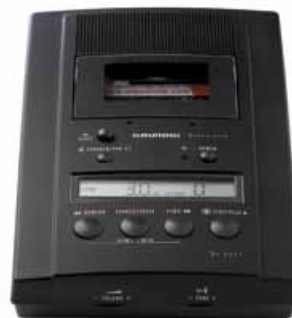
Stenorette St 3221