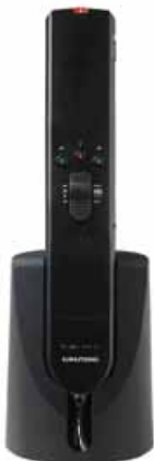
ProMic 800 FX avec pied microphone