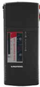
Stenorette Sh 24

Identique au modèle Sh 10, avec en plus :