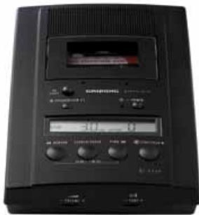
Stenorette St 3220