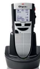
Mit Digta Station