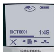
Übersichtliches Display im Easy-Mode