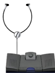
Kompatibel mit Grundig Business Systems Fußschalter und Kopfhörer.