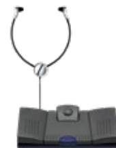
Kompatibel mit Grundig Business Systems Fußschalter und Kopfhörer.

www.grundig-gbs.com · info@grundig-gbs.com · Infoline: +49(0) 911-47 58-1