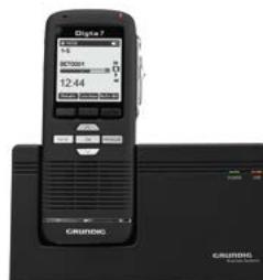
Für Digta Station

Digta W/LAN-Adapter, Netzteil, RJ45-Netzwerkkabel CAT-5, WLAN-Antenne. Download von Bedienungsanleitung & Konfigurations-tool DigtaLANConfig.exe unter: www.grundig-gbs.com/support/