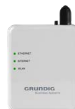
Als LAN oder WLAN Adapter